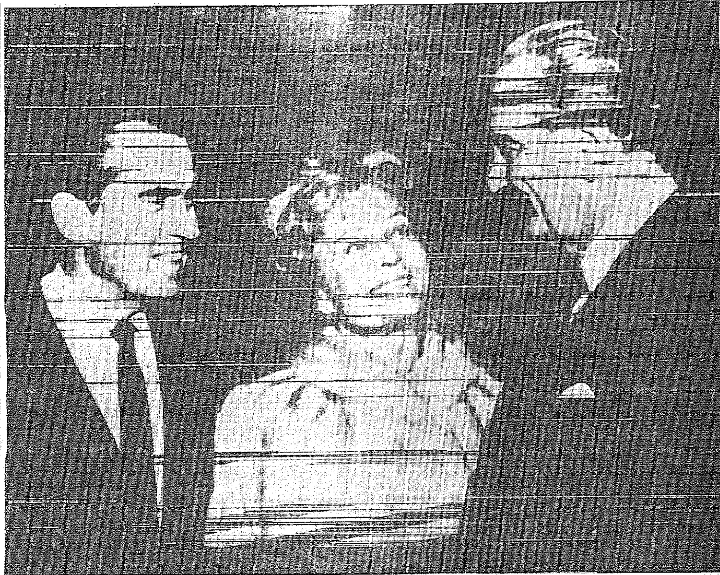
الرئيس الأمريكي المنتخب ريتشارد نيكسون ومقربيه يتلقون تحية الرئيس جونسون في البيت الأبيض يوم أمس الأول